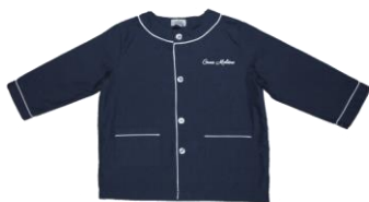
Tablier F arès navy GARÇON