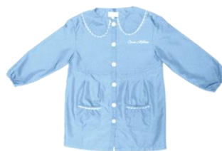
Tablier A lice sky FILLE